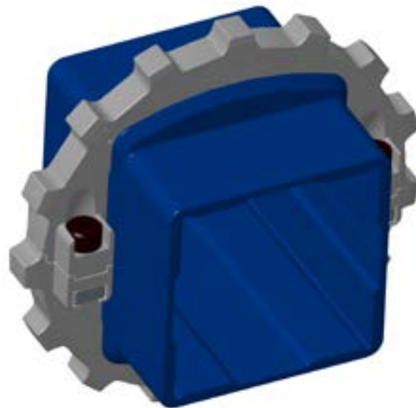
Sistema de piñones de dos piezas UltraFit: piñón y adaptador

Los adaptadores están disponibles para ejes cuadrados y en dos anchuras: 25.0 mm (0.98 in) y 76.0 mm (2.99 in)