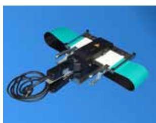
Attrezzatura Rapplon® per la giunzione veloce QSP 105

Leggere attentamente le istruzioni di giunzione.