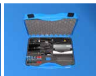
Set Rapplon® per la giunzione veloce