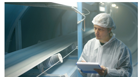
Ruhiger Lauf, flexibel für Muldenförderer

Zusätzlich zu den erforderlichen Lebensmittelnormen hat Ammeraal Beltech dank Forschung und Entwicklung Materialien und Fertigungsmethoden entwickelt, die den strengsten Industrienormen entsprechen, wie z. B. Abriebfestigkeit, Flammschutz, Antistatik und ATEX, um ein ERSTKLASSIGES Förderband zu entwickeln.