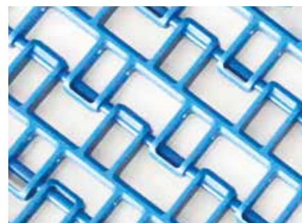
uni Flex L-OSB

Um einen unabhängigen Nachweis zu erbringen, untersuchte das Danish Technological Institute die Effizienz der neuen OSB-Bänder. Das Institut führte mit auf dem Markt verfügbaren Kunststoffspiralbändern vergleichende Luftstromprüfungen durch und ermittelte den Druckverlust.