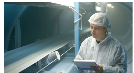
Soepele loop, flexibel voor gootbanden

Naast de benodigde voedselveiligheidsstandaarden zorgt Ammeraal Beltech R&D er ook voor dat onze materialen en productieprocessen aan de meest strenge industriestandaarden voldoen; slijtagebestendig, vlamwerend, antistatisch, ATEX goedgekeurd. Deze banden zijn met recht eerste klas producten.