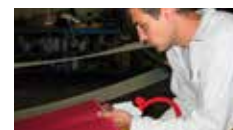
Herramienta de inserción de fácil uso

Silam y ZipLink® son nombres de marca de Ammeraal Beltech