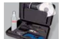
Caja completa de herramientas disponible, incluido CD de instrucciones